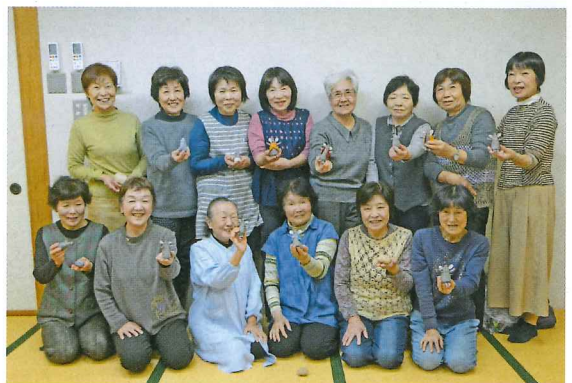
私たち、柏崎日報元旦特別号に載りました

9月から3回の講習会です。自分も作ってみたいと興味のある方はぜひ参加してください。お待ちしております。