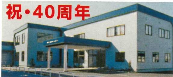
「柏崎市シルバー人材センター」竣工(平成8年11月)