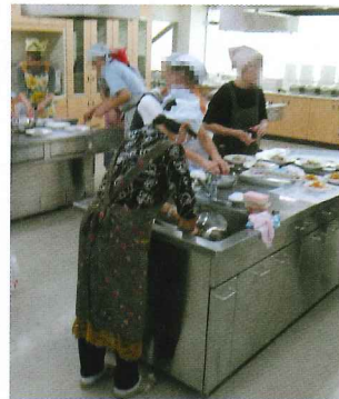
こころとカラダの健康づくり

期間 令和元年9月13日 参加者 10名 内容 健康づくりの秘訣、ポイントと調理実習を通じて、食の大切さを学びました。