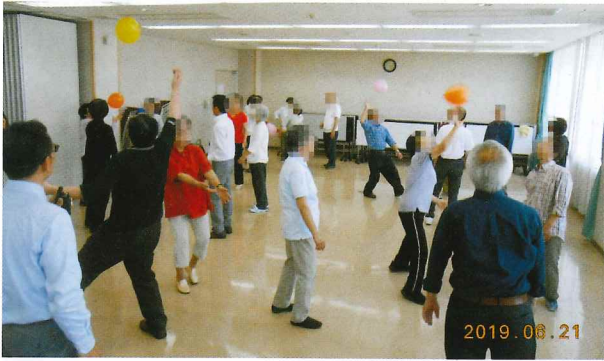
いきいき健康教室

期間 令和元年6月21日 参加者 29名 内容 日常的に身体を動かしたり、実技を交えて仲間と楽しく交流する方法を学びました。