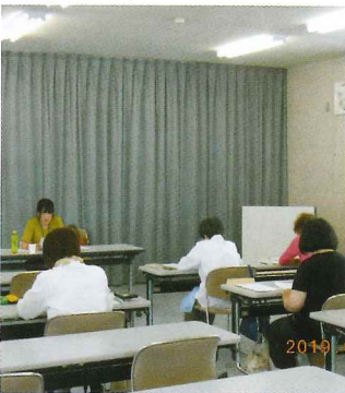
放課後児童クラブのしごと体験

期間 令和元年6月27日 参加者 7名 期間 令和元年9月25日 参加者 6名 内容 児童クラブの仕事内容や補助員としての役割と心掛けについて学びました。