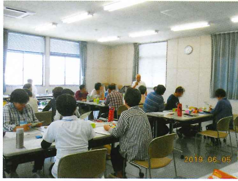
児童クラブ補助員養成研修

期間 令和元年6月5～6日 参加者 10名 内容 児童クラブ補助員としての知識を学びました。