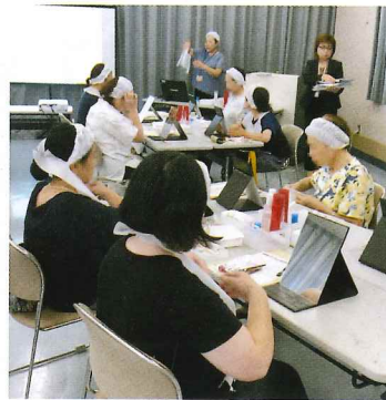
いきいき美容教室

期間 令和元年9月5日 参加者 16名 内容 講師に合わせて肌のお手入れ、メイクを楽しむながら簡単に綺麗になれる方法を学びました。