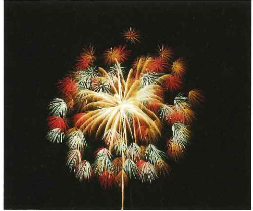
柏崎のぎおん花火