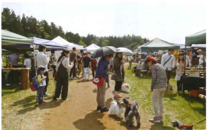
クラフトフェア風景