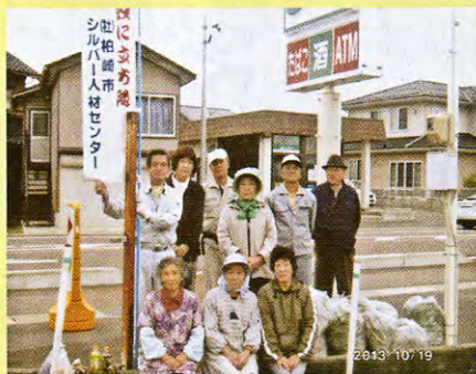
旧田塚郵便局周辺道路 ごみ拾い・草取り