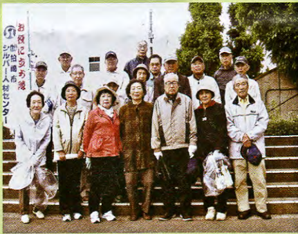
市役所・駅前歩道 ごみ拾い・清掃