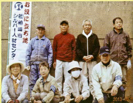
警察署・白竜公園歩道 ごみ拾い・除草