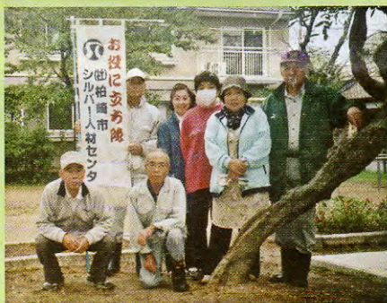
東部児童公園 草取り・落ち葉、ごみ拾い