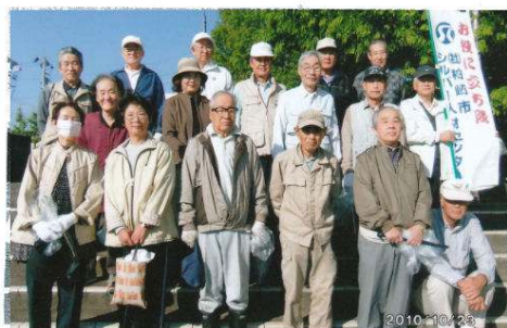
市役所、駅前公園歩道 ごみ拾い