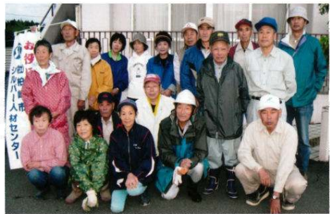
高田・上条地区 1〜3班