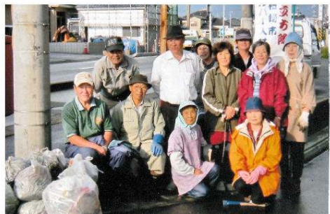
田塚郵便局周辺道路 ごみ拾い、草取り