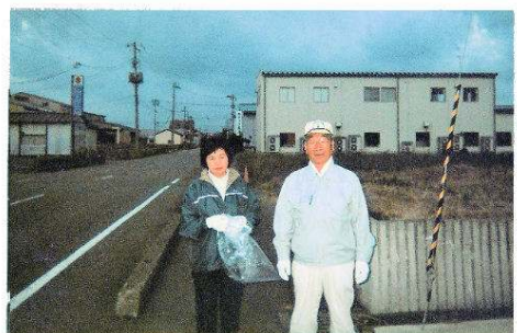
訪問看護ステーション 「つくし」周辺道路ごみ拾い