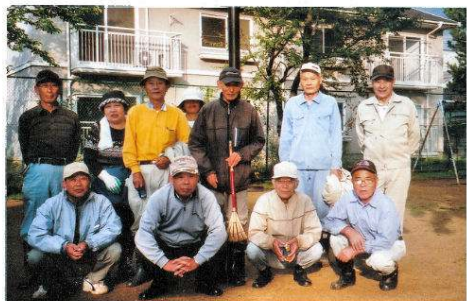
比角コミセン脇の公園 草取り、落ち葉拾い