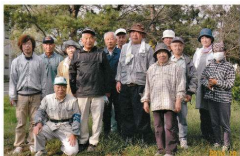
警察署、白竜公園歩道 清掃、除草