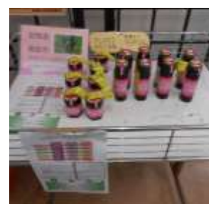
他市シルバー商品販売の様子