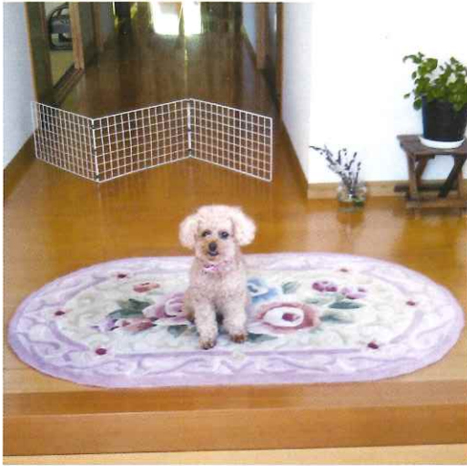
家で待っているのは