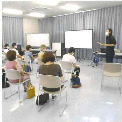
訪問介護員全体研修