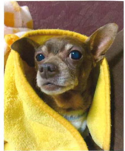
長い間ありがとう

具合の悪い日が続いているにもかかわらず、私の姿、やる事を目に焼きつけるかのように見ていてくれました。亡くなる2日前の姿です。