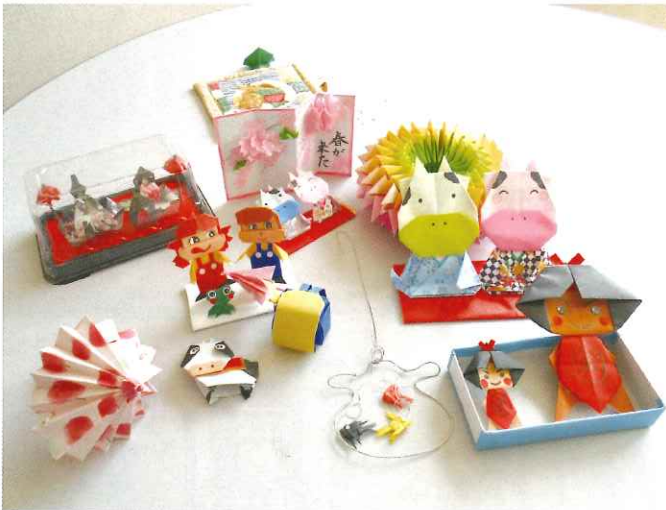
ペーパークラフト