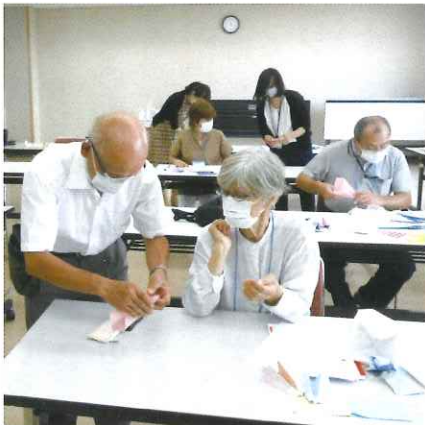
放課後児童クラブ補助員の仕事体験

業する際に必要な補助員としての役割と心構え、子どもとのレクリエーションを楽しく学びました。